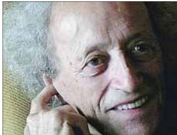
Bernard Noël.

Ciselure des mots, des phrases qui telle une étreinte transporte la lectrice, le lecteur dans une sensualité sublimée : « Elle rêvait de la montée d'une parole unique, qui occuperait à la fois, ses deux bouches en créant de l'une à l'autre un unisson qui rendrait la chair aussi spirituelle que l'âme, et