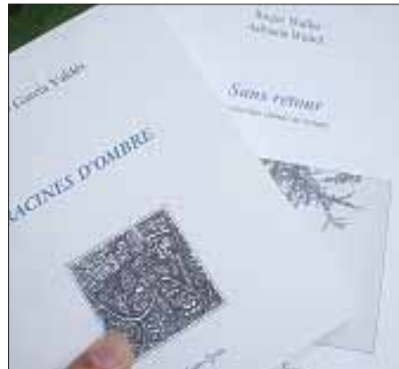
« Racines d'ombre », d'Olvido Garcia Valdès et « Sans retour », de Roger Walllet et Adriana Wattel.

C'est le cas, par exemple, de Sans retour, le cimetière chinois de Nolette , écrit par l'écrivain picard, Roger Walllet et illustré par la photographe Adriana Wattel. Ce roman, d'une