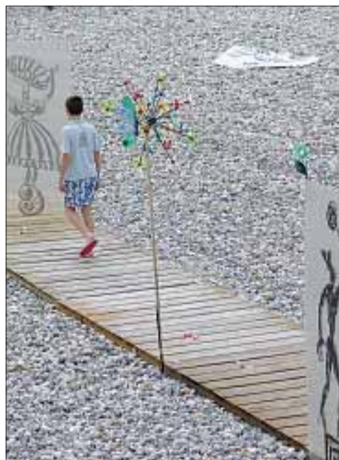
Lors de la 4 e édition du salon, une déambulation sur les planches entre cerf-volant et illustrations.